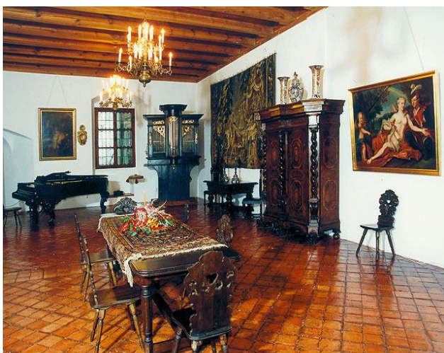
Jedna z sal na zamku