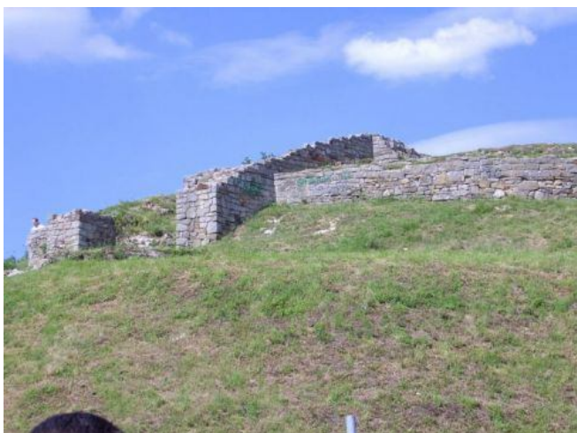
Ruiny zamku Tarnowskich na Górze św. Marcina