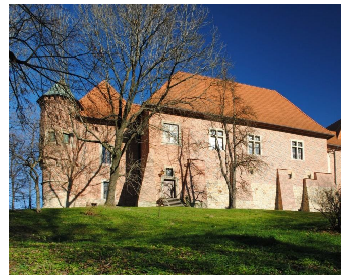
Gotycki zamek w miejscowości Dębno

◆ Tylko u nas możesz spotkać ducha Tartłówny na Zamku w Dębnie