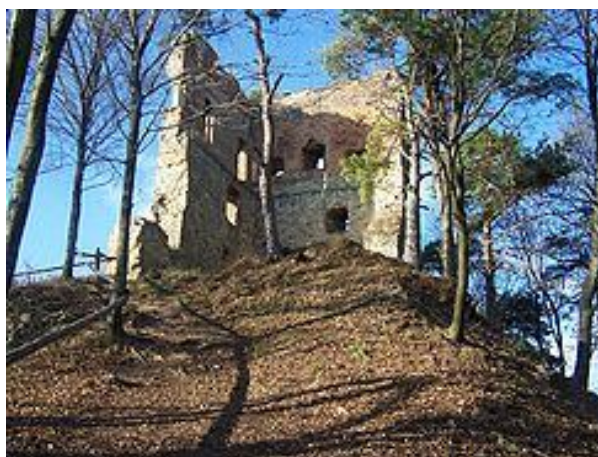
Ruiny zamku w Melsztynie